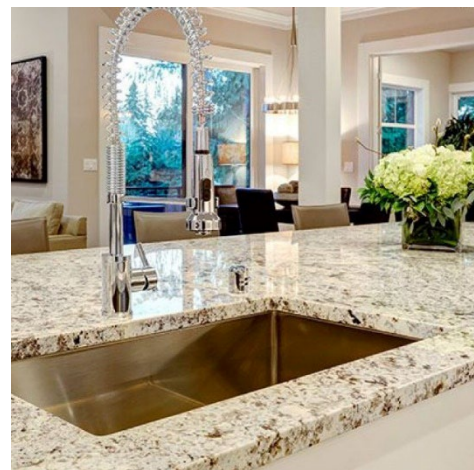
Encimera de granito