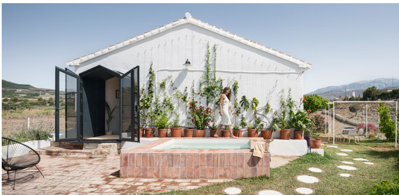
La Centinela: rehabilitación espacial, estructural y energética de una infravivienda rural y su relación con el paisaje agrícola | Francisco Ortega Ruiz

La presentación de los trabajos a los Premios Málaga de Arquitectura implica la autorización de cesión al Colegio Oficial de Arquitectos de Málaga de los derechos. En caso de uso de la documentación aportada en esta edición, se indicará debidamente el crédito correspondiente al autor/a o los autores/as de los trabajos y de las fotografías pudiendo aparecer en cualquier tipo de soporte, editado, impreso o digital vinculado con el Colegio de Arquitectos de Málaga y la difusión de sus actividades, incluido en internet.