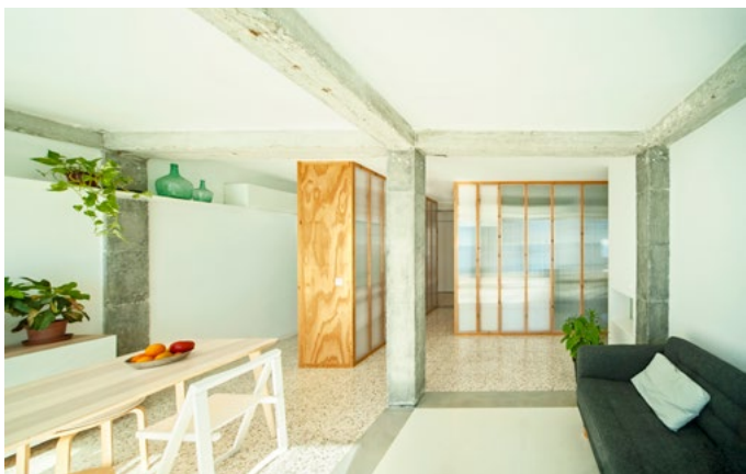
Mezq. Casa de reflejos y luz del mar | Sergio Cobos Álvarez y Aurelio Dorransoro Díaz