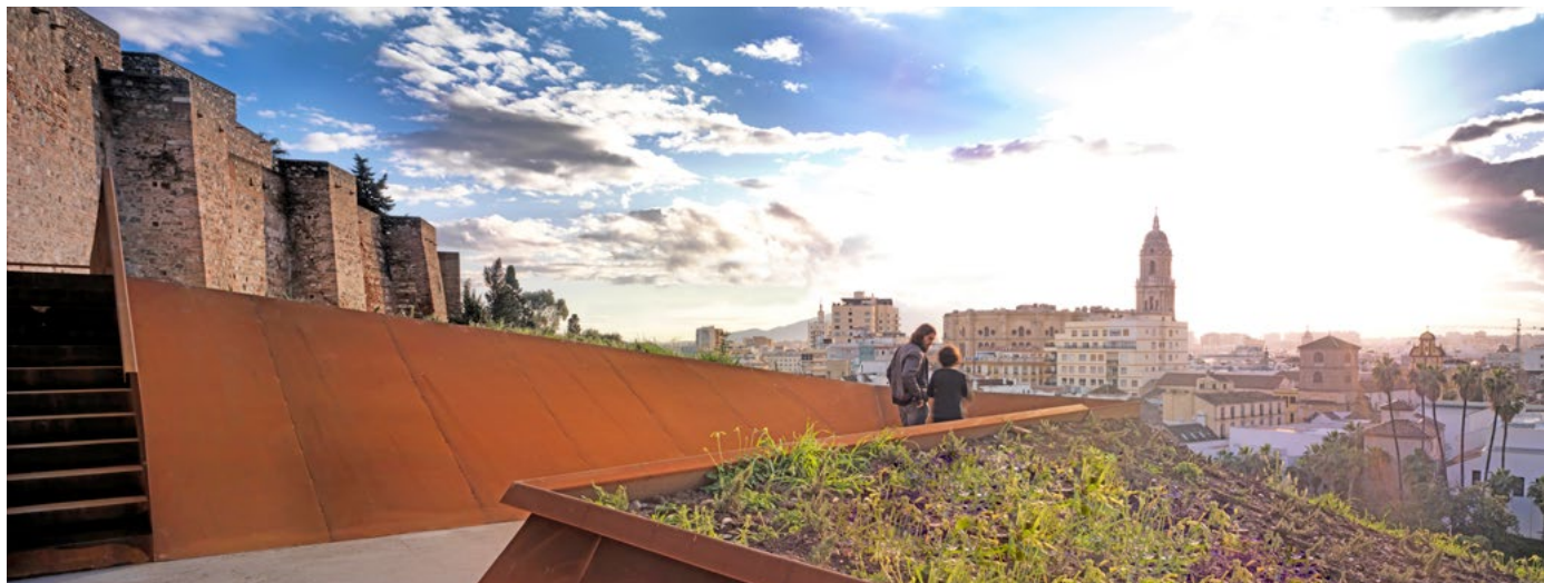
Rehabilitación ladera de la Alcazaba y Teatro Romano de Málaga | José Ignacio Pérez de la Fuente | Fotografía: Jesús Granada