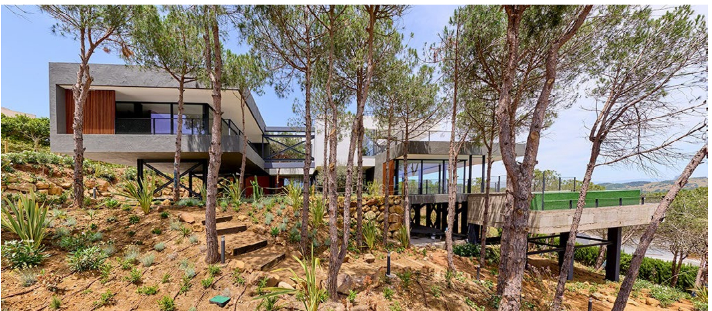
Villa en c/ Grazalema (Sotogrande, Cádiz) | Ignacio Merino Rivero

Los premios consistirán en un trofeo y un diploma acreditativo para el autor y un diploma acreditativo para el promotor de la actuación.