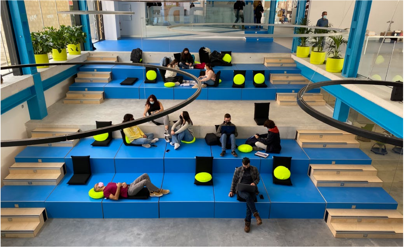
Reforma Escuela de Arquitectura de Málaga. Universidad de Málaga | Ferrán Ventura Blanch