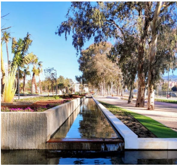
Renovación urbana del sector Martiricos en Málaga Jose Luis Dorransoro Arigo, Santiago Dorransoro Arigo y Ana Dorransoro Arigo

Esta modalidad tiene como objetivo premiar aquellos instrumentos urbanísticos, ejecuciones de proyectos de obras de urbanización y/o actuaciones de rehabilitación urbana e intervenciones de paisajismo, en todas sus escalas, ubicadas en la provincia de Málaga, por la calidad de estos trabajos de planificación y/o de estrategia urbana o territorial incluidas en documentos de planeamiento y/o por el diseño de sus espacios libres, parques o plazas.