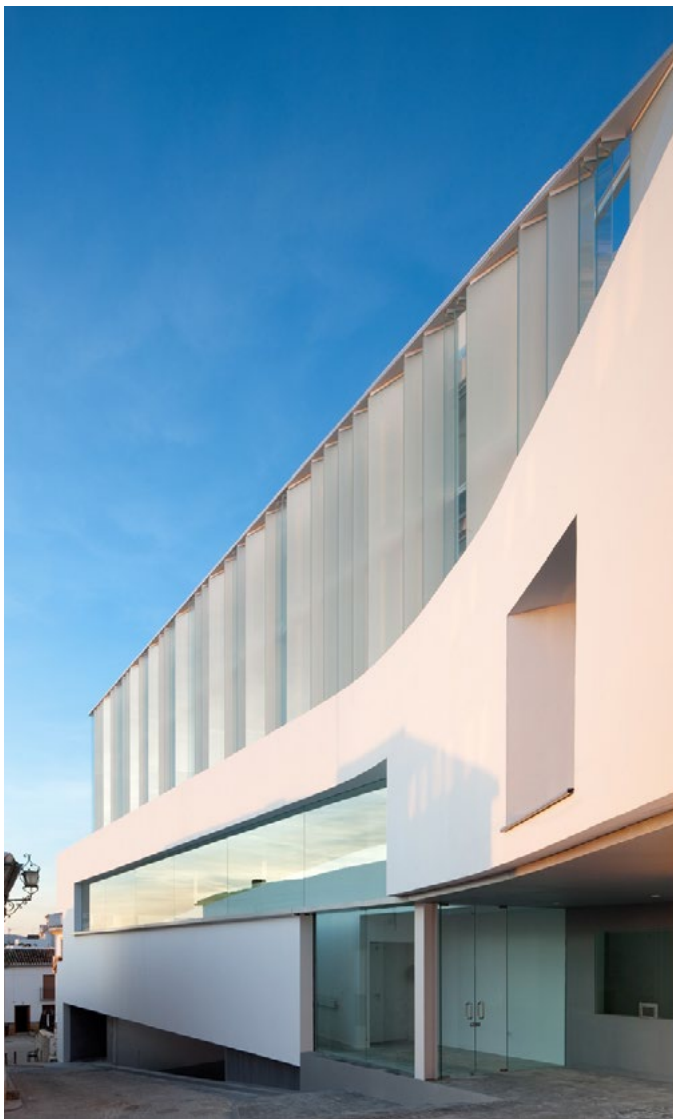
Centro cultural y nueva sede del Ayuntamiento de Archidona | Ramón Fernández-Alonso Borrajo