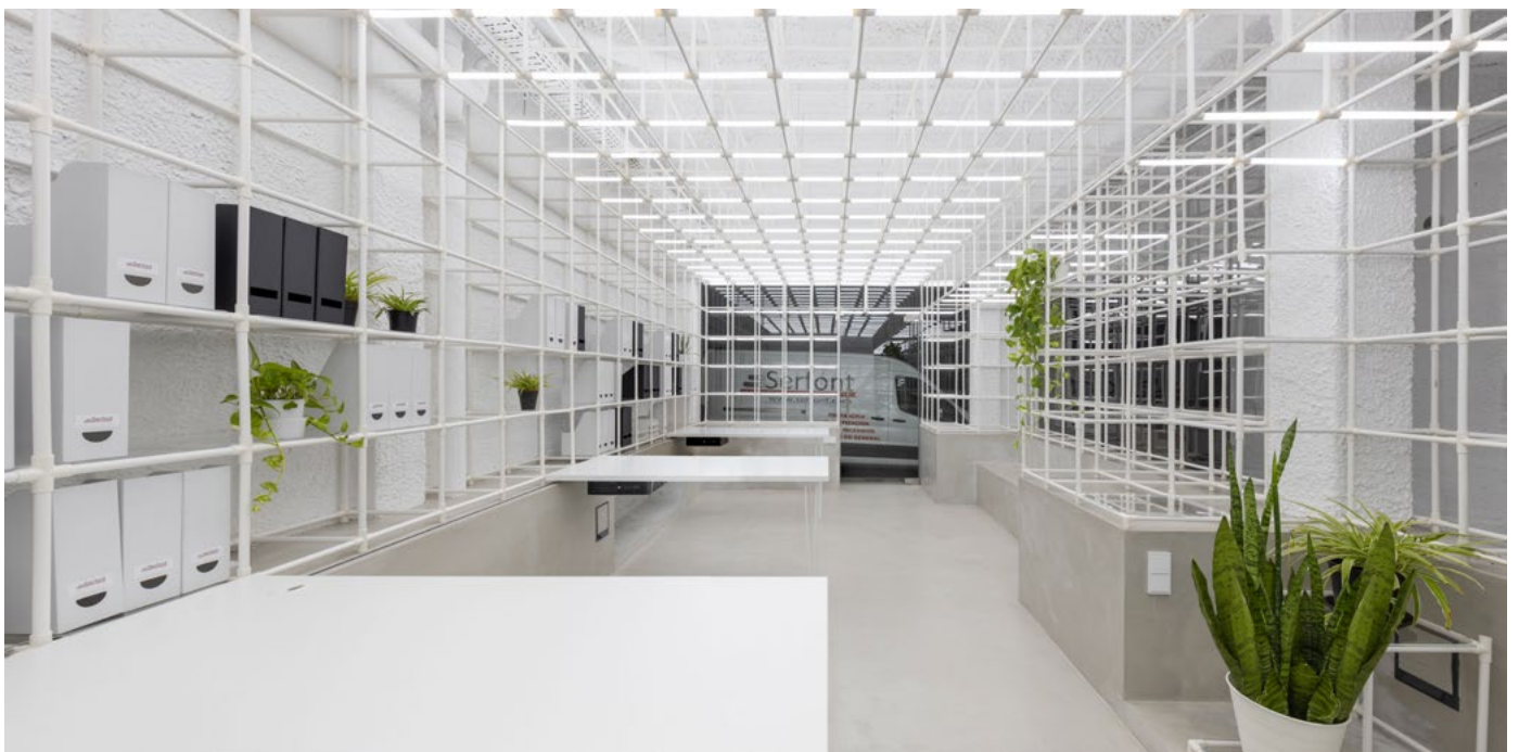
Oficina en almacén de fontanería. Sede Serfont | Miguel Ángel Gilabert Campos

El dossier se realizará en formato pdf , con resolución mínima de 300 ppp y tamaño máximo de fichero 7 Mb .